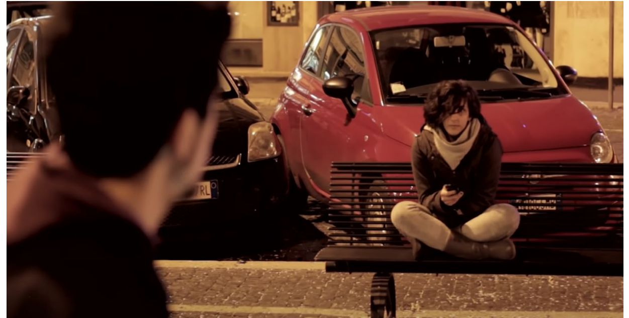
Immagine tratta dal video "Whatsapp Down 4 min" usato come stimolo (vedi materiali)